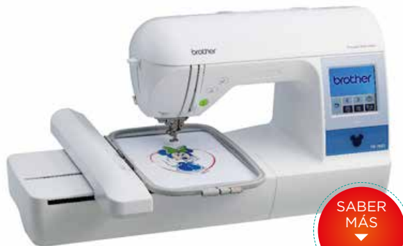
MODELO: PE 780D