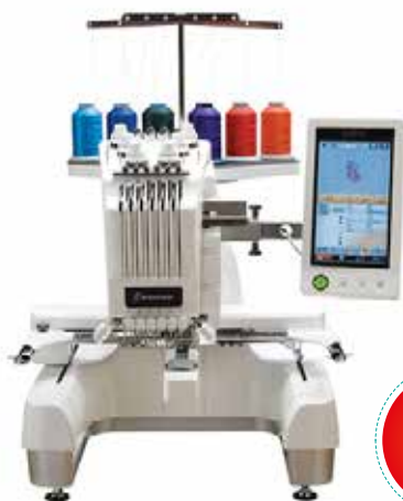
MODELO: PR 655/655c