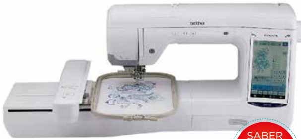
MODELO: BP 2100