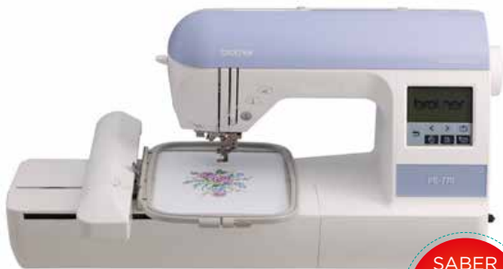
MODELO: PE 770