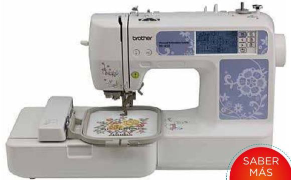
MODELO: PE 450