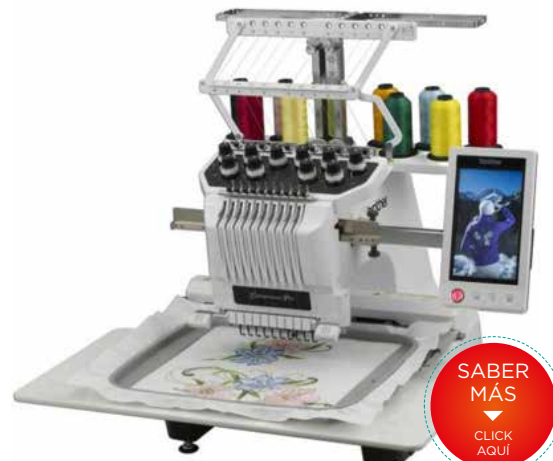
MODELO: PR 1000e