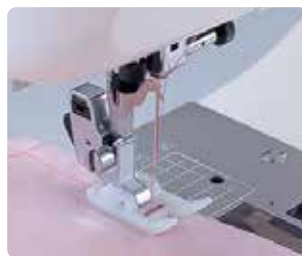
SA 114 Prensatela anti-adherente