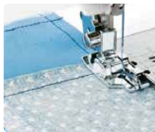
SA 185 Pie 1/4" con guía