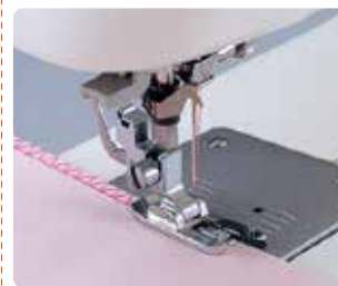
SA 135 Prensatela de sobrehilado