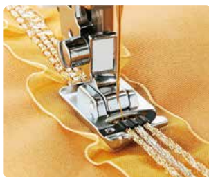
SA 110 Pie 3 cordones