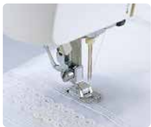
SA 162 Prensatela de alforzas