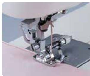
SA 134 Pie dobladillo