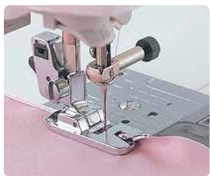
SA 126 Pie roulotte