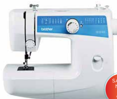
MODELO: LS 2125