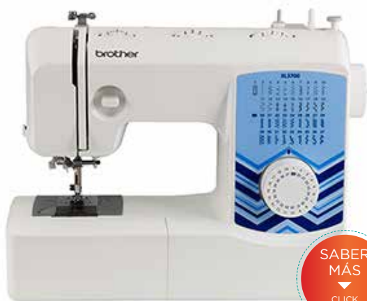
MODELO: XL 3700