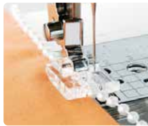
SA 150 Pie de perlas