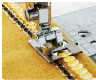
SA 141 Prensatela cintas y lentejuelas