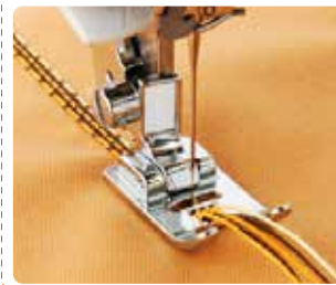
SA 157 Pie de cordones