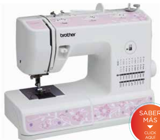
MODELO: XL 5800