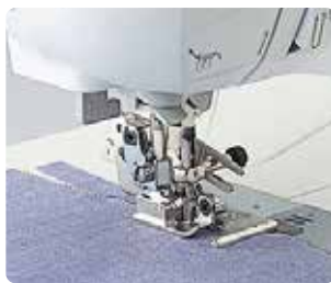
SA 177 Pié cuchilla lateral