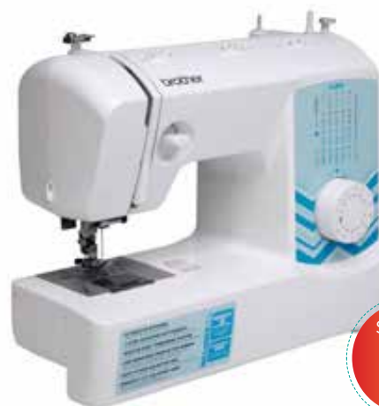
MODELO: XL 2800