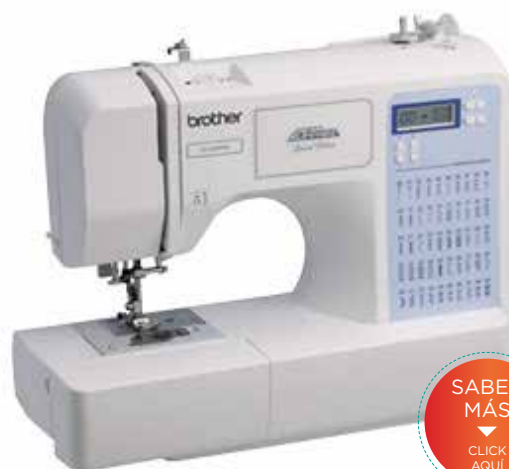
MODELO: CE 5500