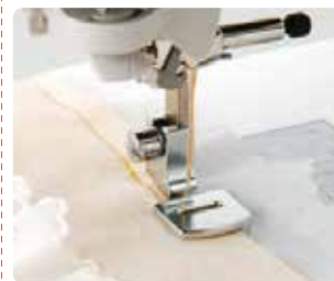
SA 120 Pie fruncidor