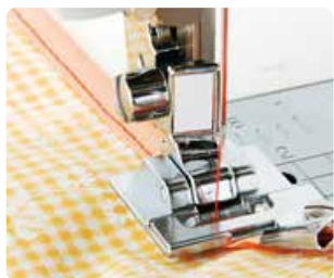
SA 109 Prensatela cinta al bias