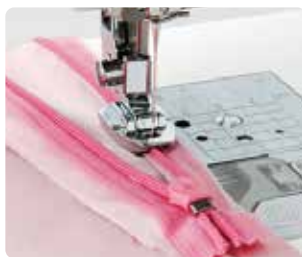
SA 128 Pie cierre invisible