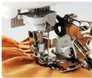
SA 143 Pie fruncidor