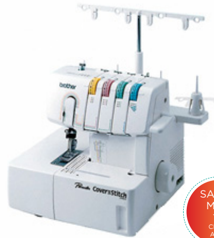
MODELO: 2340 CV