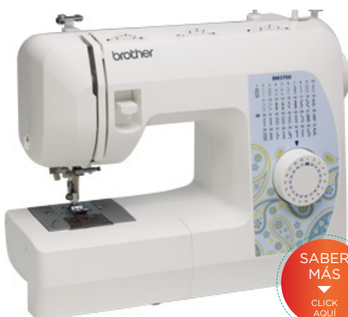
MODELO: BM 3700