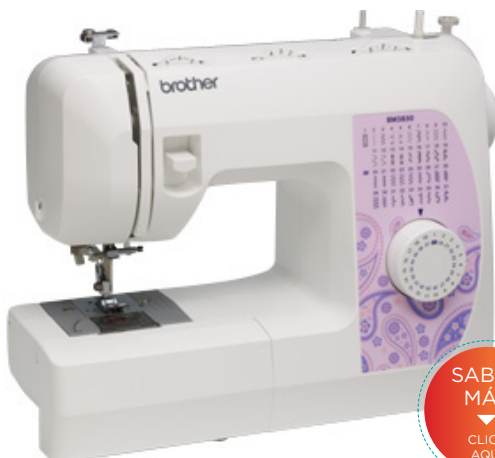
MODELO: BM 3850