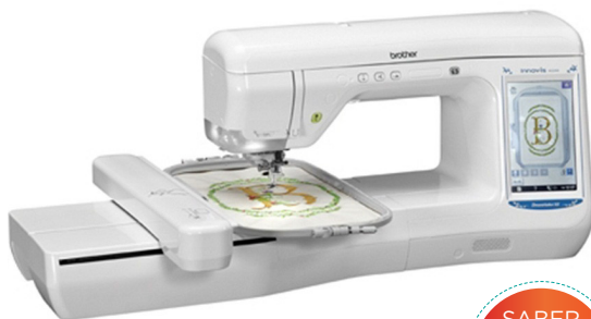
MODELO: BP 2100