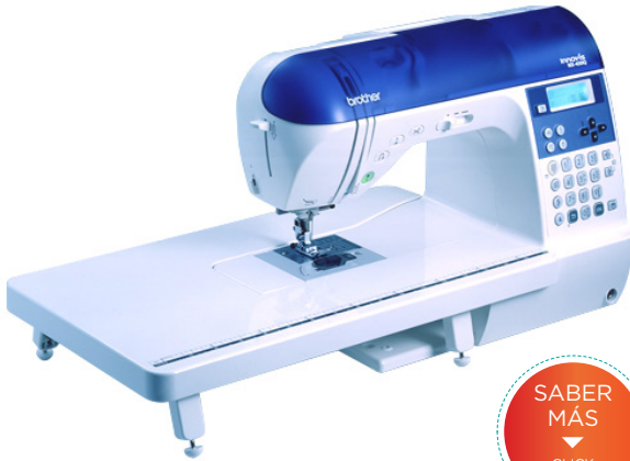
MODELO: NX 450Q