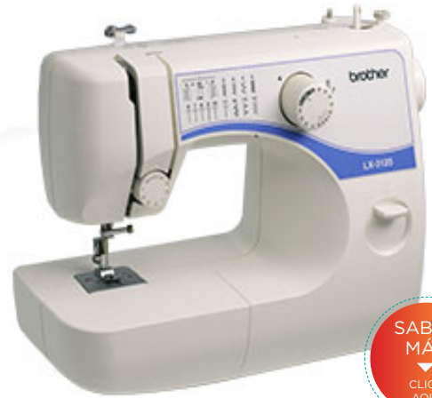
MODELO: LX 3125