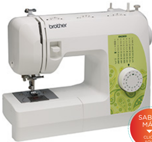
MODELO: BM 2800