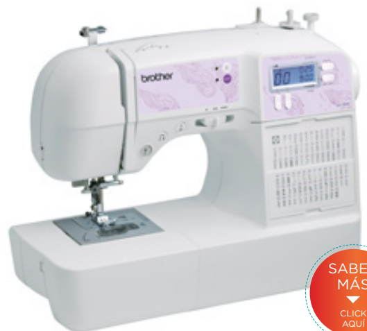
MODELO: SQ 9000