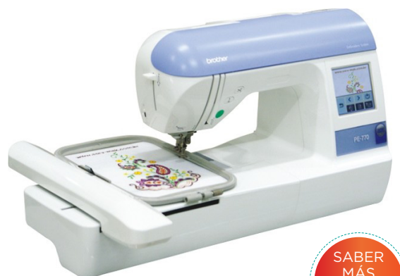
MODELO: PE 770