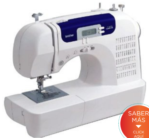
MODELO: CS 6000i